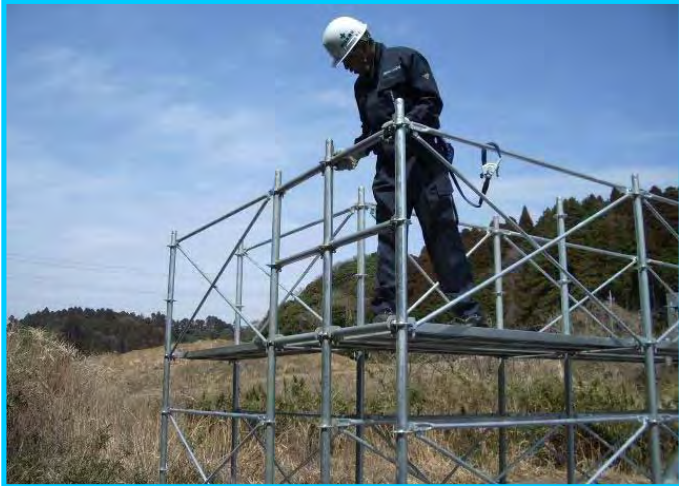
25) エンドストッパー布材取付け(2段)