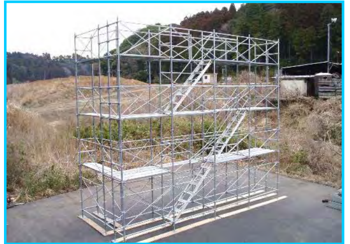
44) 布枠、階段、階段手すり取付け完了