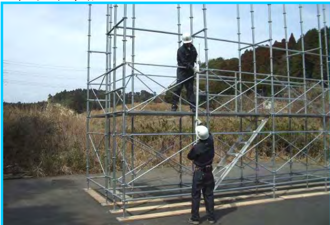
29) 先行手すり筋交い取付け