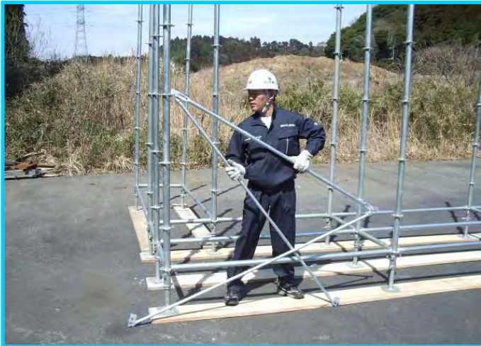
9) 先行手すり筋交い取付け