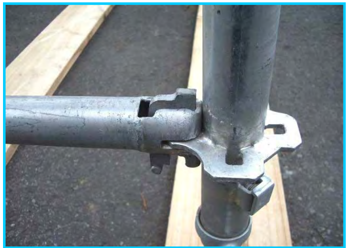
8) 支柱プレートロック後