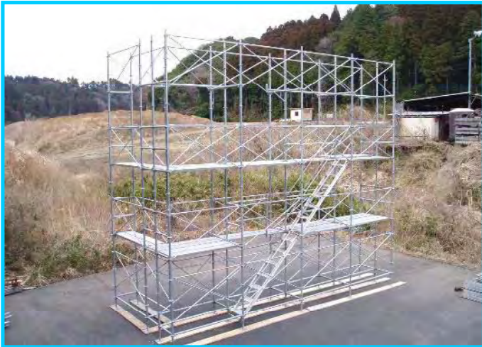
43) 4段目先行手すり筋交い取付け完了