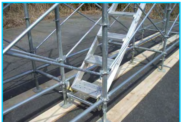
22) 階段取付け、階段受け取付け