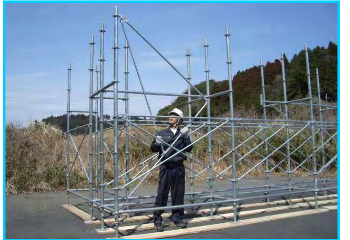
18) 先行手すり筋交い取付け