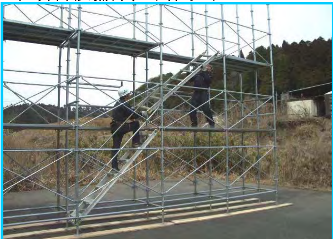
35) 2 段目階段取付け