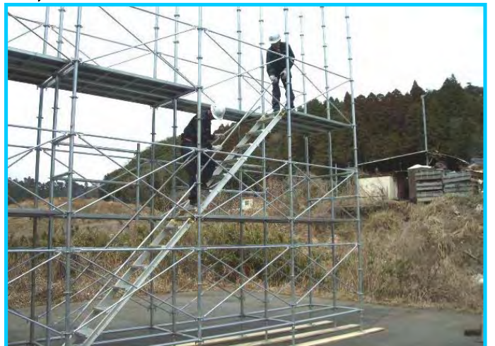
36) 2 段目階段手すり取付け