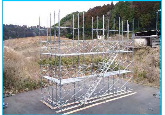
42) 4段目布材取付け完了