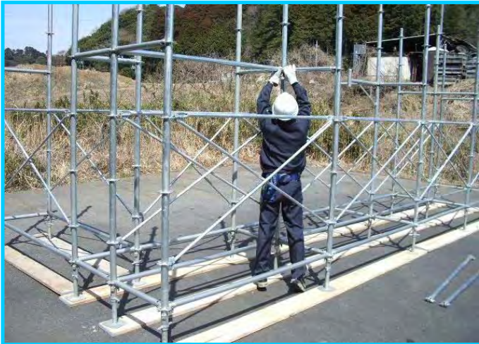
17) 布枠隙間養生の為、布材取付け