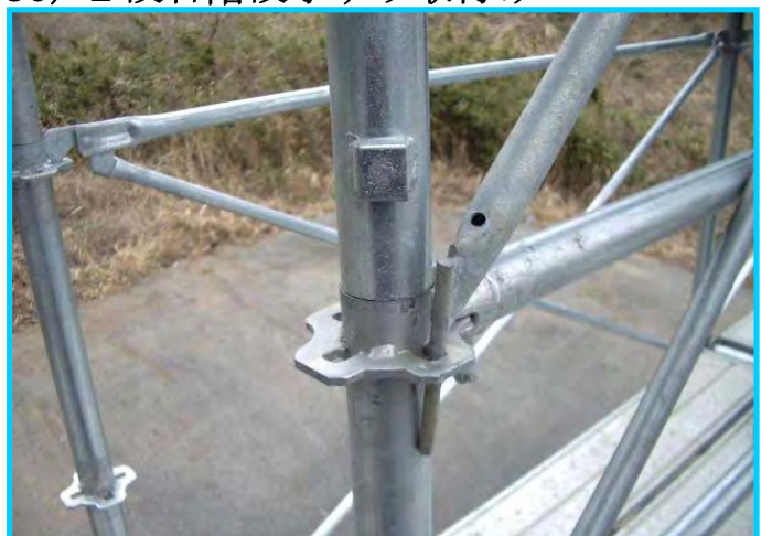
38) 階段手すり取付け部 (下部)