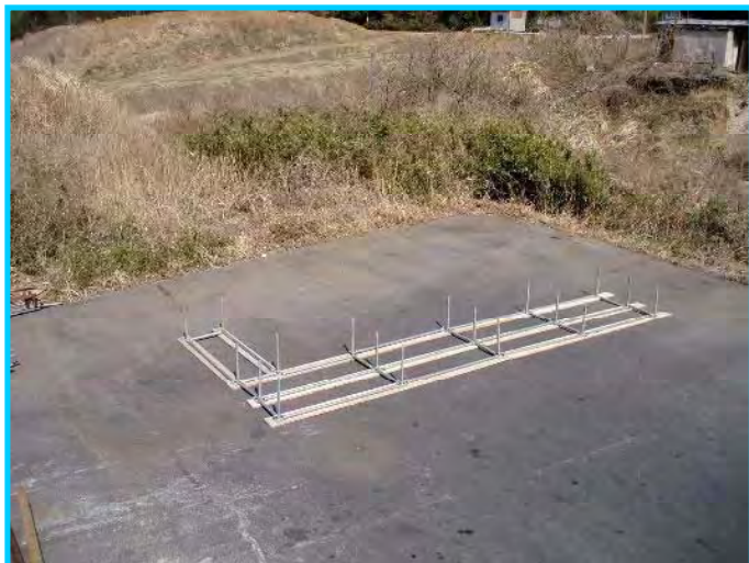
1) 敷板、ジャッキベース、布材の間配り