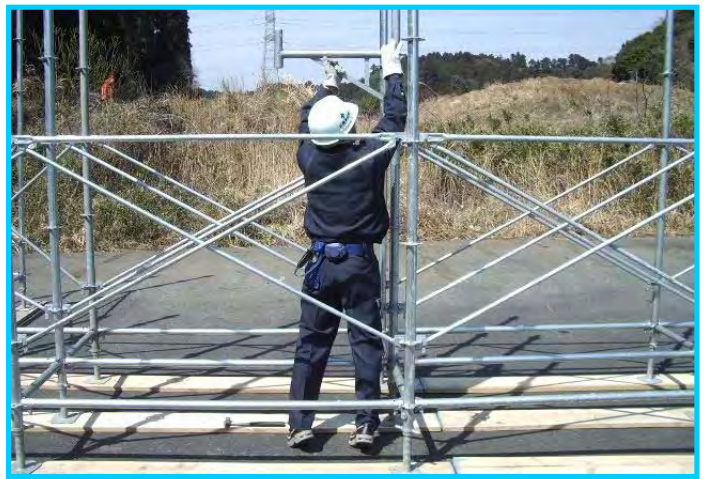
16) 昇降設備部にピンブラケット取付け