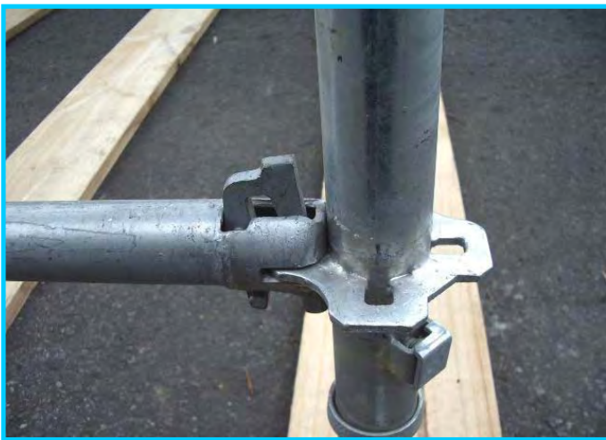
7) 支柱プレートロック前