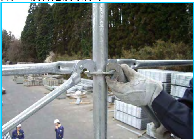
37) 階段手すり取付け部 (上部)