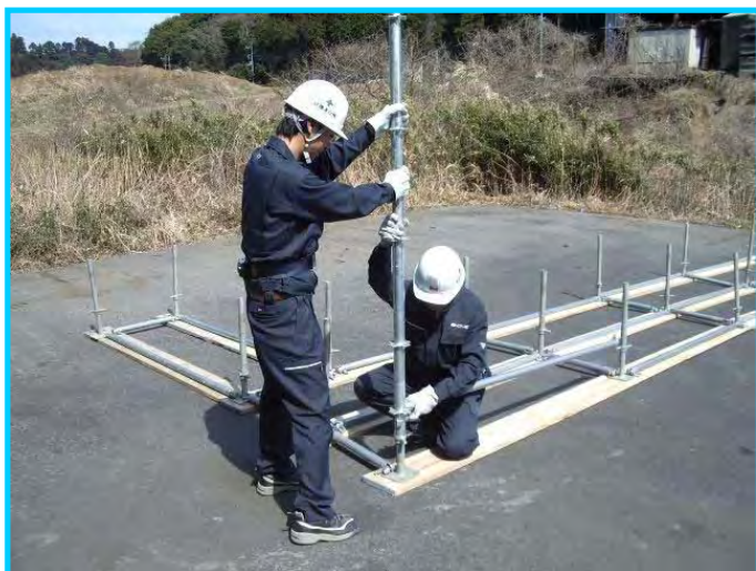
3) 支柱プレートに布材をクサビで仮留め