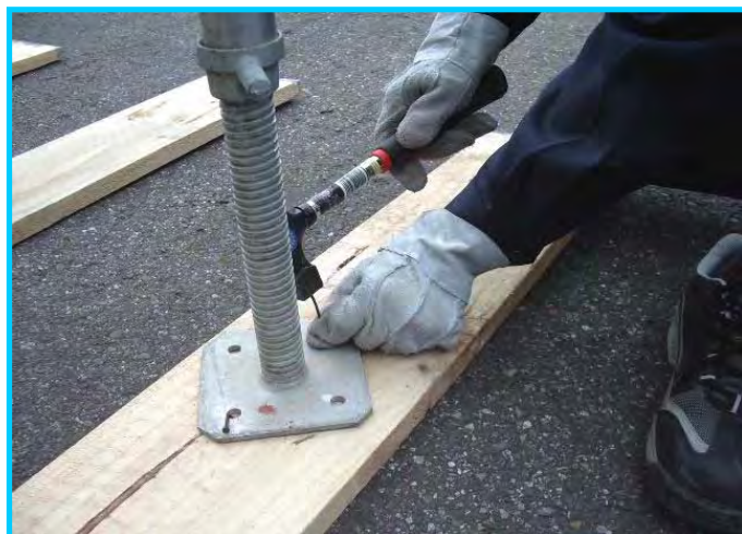
6) 敷板にジャッキベースを釘止め (2箇所)