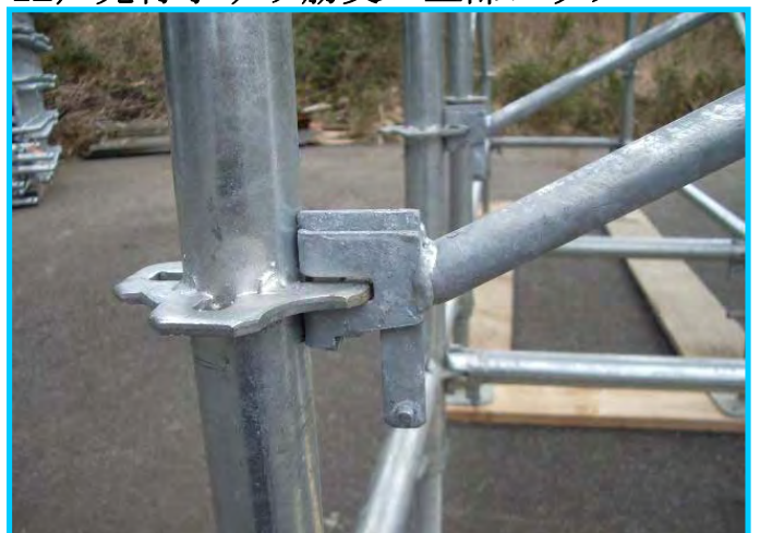
14) 先行手すり筋交い下部金具 (ロック後)