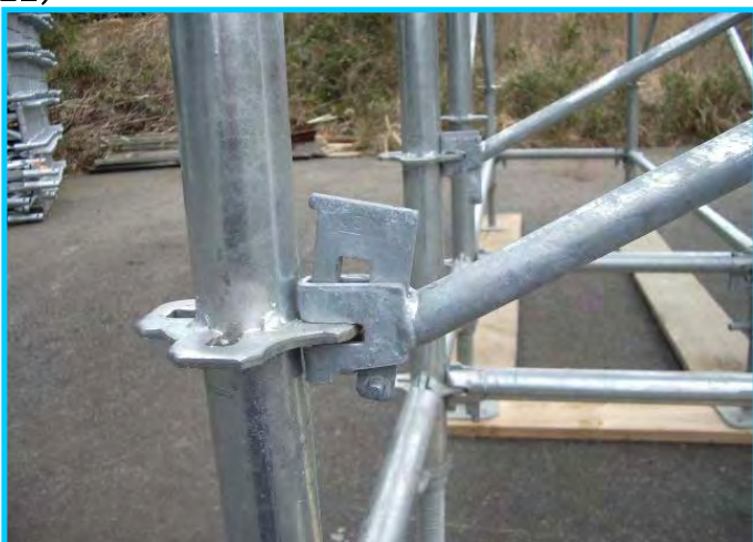
13) 先行手すり筋交い下部金具 (ロック前)