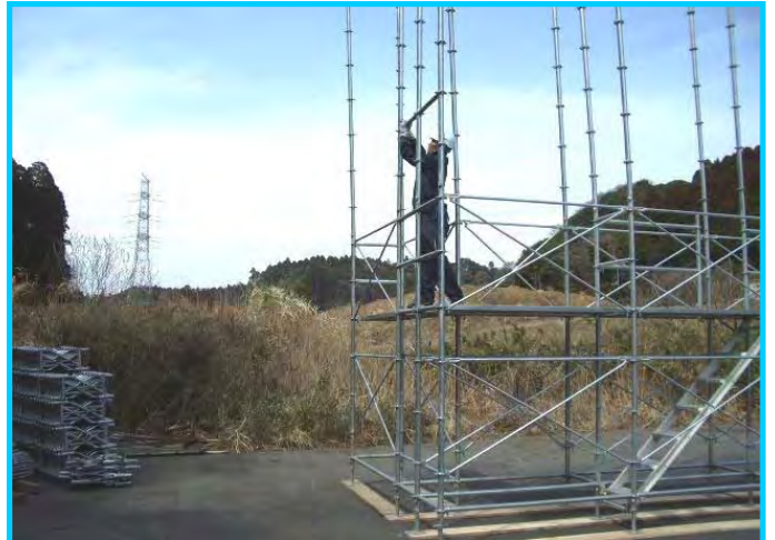
28) 布枠取付位置に布材取付け