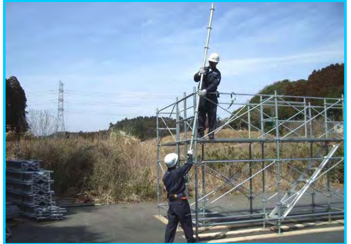
26) 支柱 P36 取付け