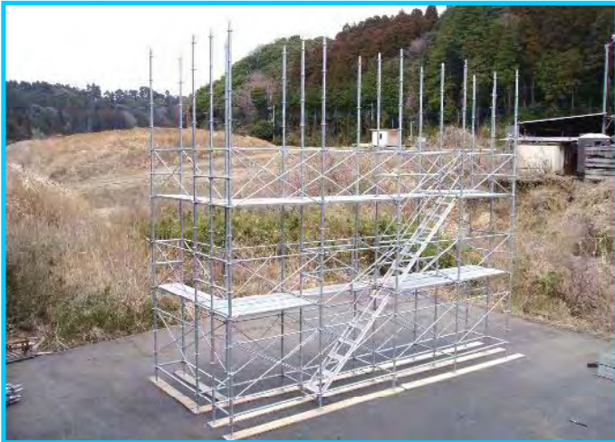
41) 三段目エンドスットッパー布材取付け完了