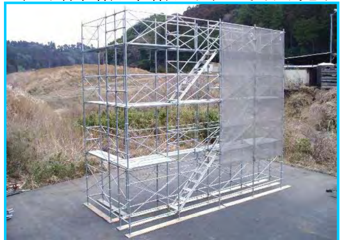
46) メッシュシート取付け完了