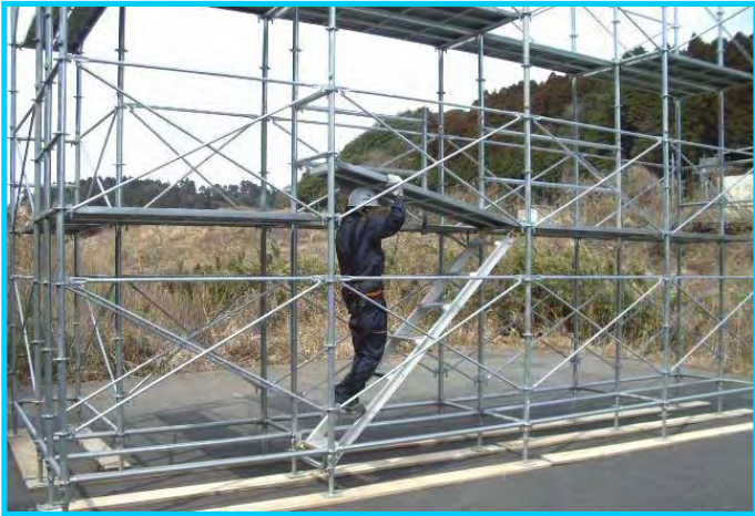
33) 昇降設備部、布枠取外し