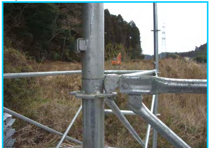
12) 先行手すり筋交い上部フック