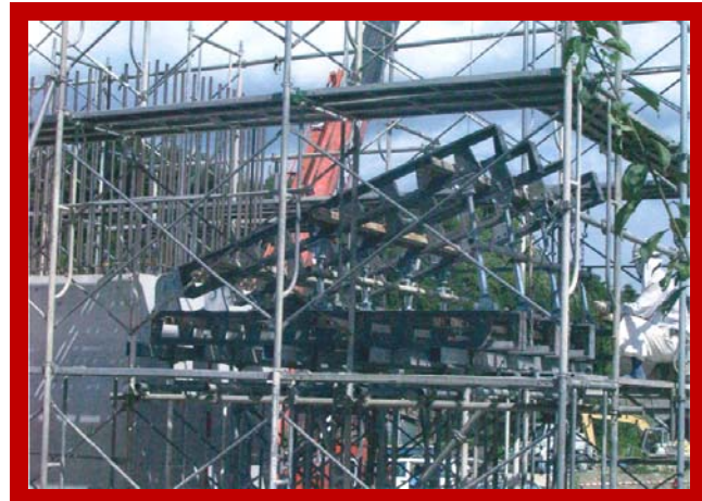
施工時(右ウイング)