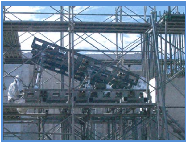
施工時(左ウイング)